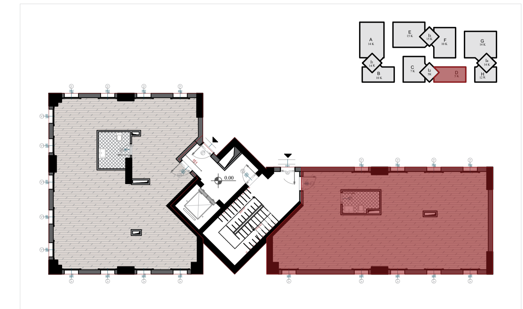
PLANIMETRIA E SHERBIMIT NR. 02